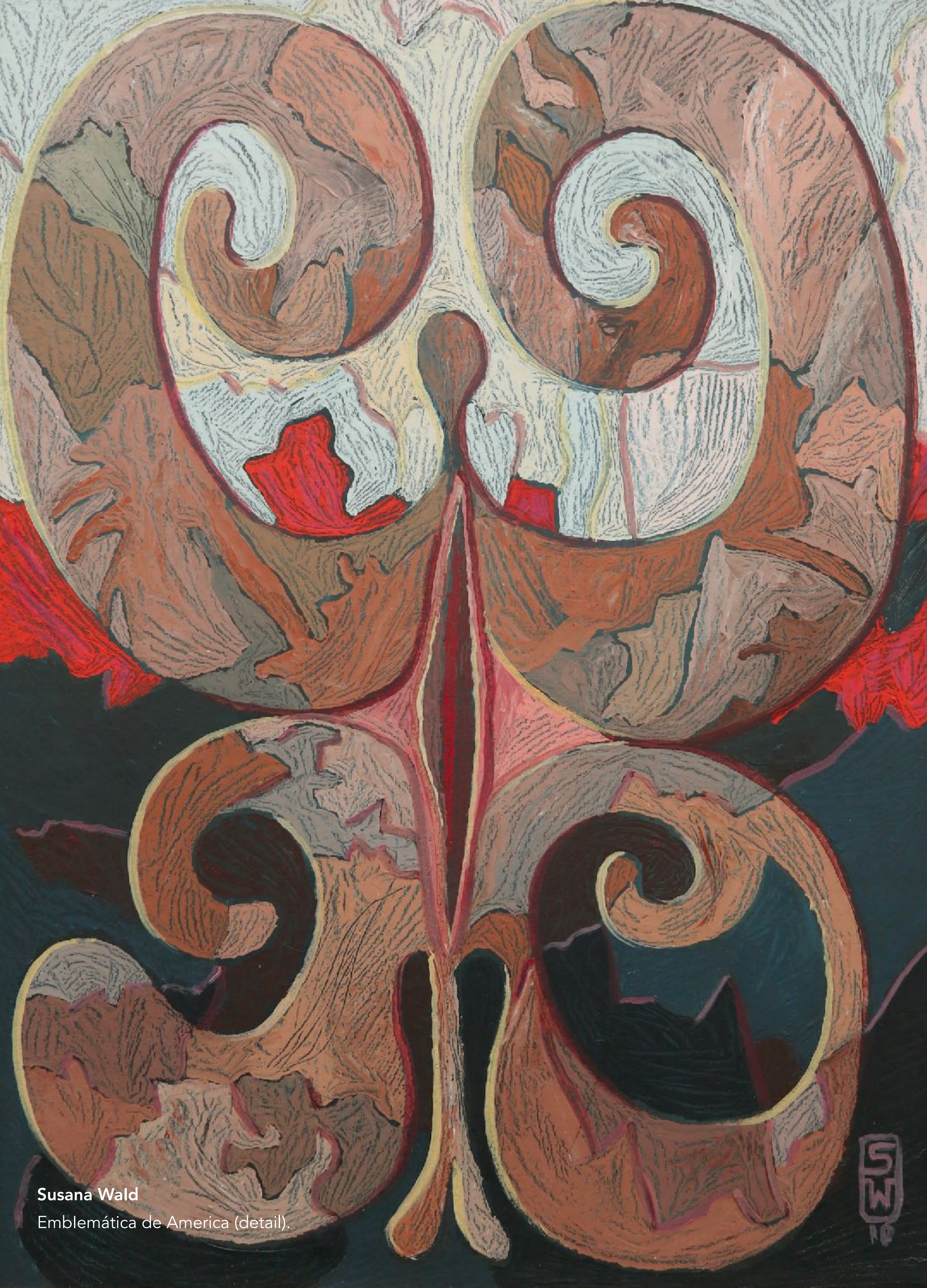
Susana Wald Emblemática de America (detail).